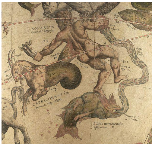
Sterrenkaart , waterman met de kruik

Sommigen zijn van mening dat 21 december ook fysiek merkbaar zou kunnen zijn en spreken van drie of zeven dagen van duisternis die het gevolg zouden kunnen zijn van deze conjunctie, waarbij ook de doortocht door de zogeheten fotonengordel (een immense gordel van lichtdeeltjes) een rol zou spelen. Dat 21 december 2012 wereldwijd een ongelooflijke hype is geworden en velen de spirituele betekenis van die datum niet meer kunnen zien, heeft onder andere te maken met de desinformatie van de mainstreammedia, die deze kosmologisch belangrijke datum bagatelliseren of met de nodige hilariteit of onbekwaamheid uitleggen als het einde van de wereld in plaats van als het einde van een tijdcyclus , een wereldperiode.