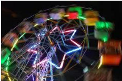
Amusementsindustrie viert hoogtij

Jongeren raken steeds meer stuurloos. De geweldspiraal neemt toe, al jaren gevoed door gewelddadige films en videospelletjes, drugs en farmaceutische ‘geneesmiddelen’, slechte voeding en gebrek aan voorbeeldgedrag van ouders en leerkrachten, het toelaten van krachten die bewust het gezin en de menselijke relaties verstoren en echtparen als tweeverdieners hebben uitgeleverd aan een hypothecaire schuldenberg door langlopende leningen tegen woekerrente. Talloze jongeren hunkeren naar spirituele voorbeelden, maar worden weggezogen in het moeras van een virtuele wereld, materie, herrie, drugs, begeerte, geweld, normloosheid, pestgedrag.