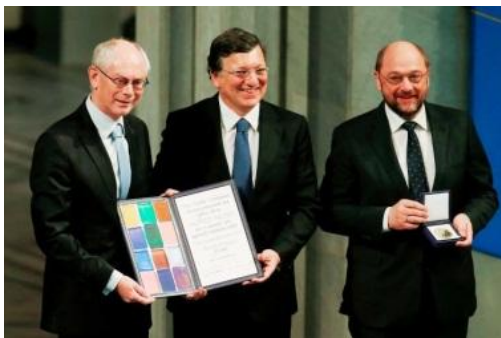
Ontvangst Nobelprijs voor de vrede

Op 10 december jl. nam in Oslo het trio Van Rompuy, Schulz en Barroso 'namens vijfhonderd miljoen burgers van de EU' (!) de Nobelprijs voor de vrede in ontvangst .