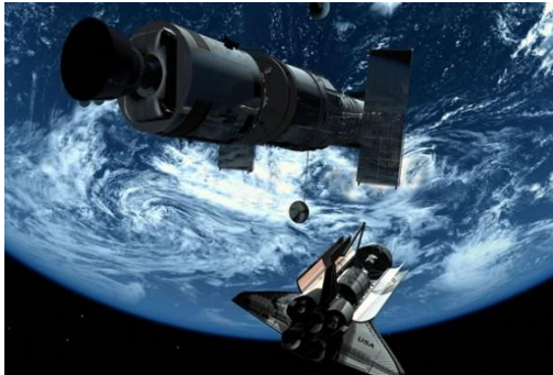
NASA doorzoekt de ruimte

Doha (Qatar) ook weer niets op. Ingrijpende veranderingen in het zonnestelsel worden door de NASA van dag tot dag gevolgd. Sommige onderzoekers zijn van mening dat planeet X (Nibiru?) ons zonnestelsel aan het binnenkomen is. Anderen, vaak geïnspireerd door religieuze visies of overtuigingen, menen te kunnen bewijzen dat een grote komeet naar de aarde onderweg is en dat binnenkort het ‘einde der tijden’ aanbreekt. Ongetwijfeld speelt H.A.A.R.P bij de vele klimaatveranderingen een demonische rol.